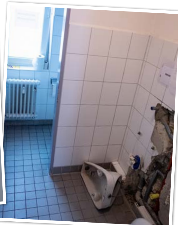
Aufgrund eines Wasserschadens waren die Toiletten nur eingeschränkt nutzbar.