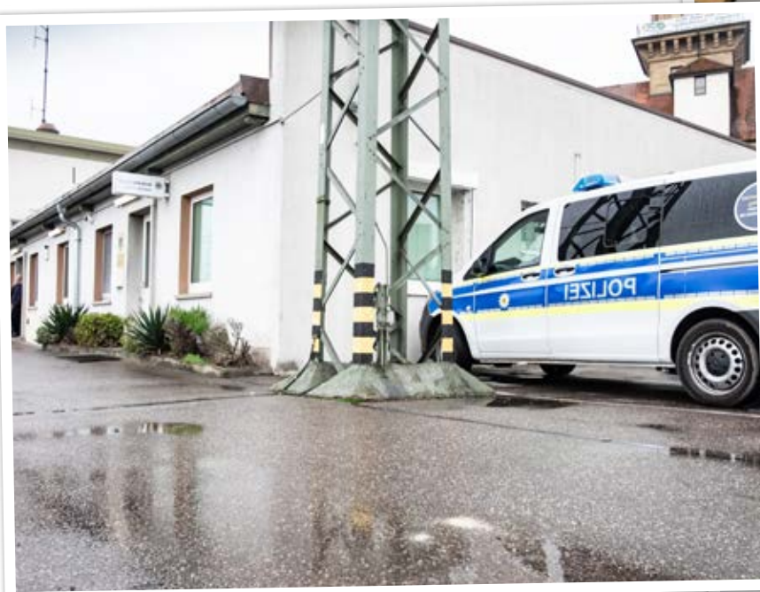
Das Bundespolizeirevier Heilbronn wird von der regionalen Presse auch als „Baracke“ bezeichnet.