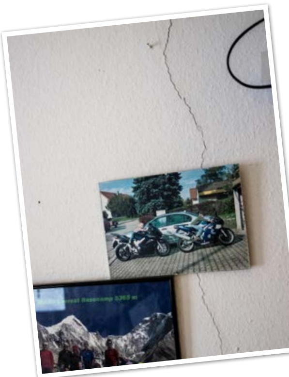
Es scheint, als würde diese Wand nur noch von Erinnerungen zusammengehalten.

aber bei weitem nicht die einzige. Noch immer gibt es viele Gebäude mit gleichen oder anderen Mängeln. Es bleibt nur zu hoffen, dass auch sie bald Geschichte sind. Ich bin beeindruckt, mit welcher Zuversicht und welchem Improvisationstalent die betroffenen Kollegen dennoch ihren Dienst verrichten. Alle anderen und mich können sie dadurch vielleicht unterstützen, die Wichtigkeiten und Nichtigkeiten der kleinen Mängel unserer eigenen Dienststellen besser einzuordnen.