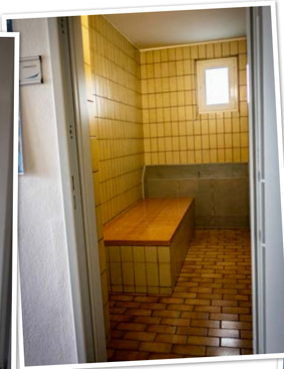
Im Verahrraum dürfen Personen nur kurzzeitig untergebracht werden.