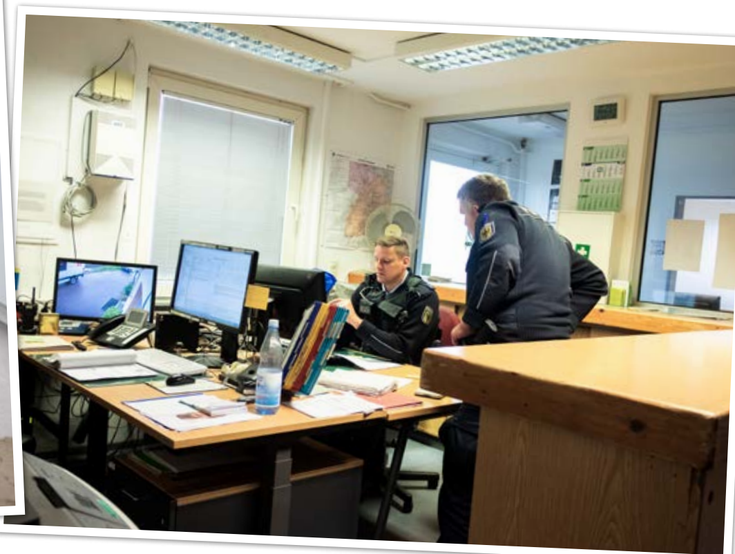
Nur der Tresen trennt die Wache vom Wartebereich. Sonstige Abtrennungen gibt es nicht.

„Das größte Problem ist die Eigensicherung.“